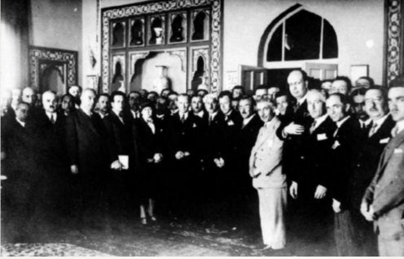
Şekil 4: Atatürk, Türk Ocağı Merkez Heyeti binasında (1930).

Türk Ocağı'na Mustafa Kemal'in gösterdiği ilgi ve desteğin sadece kişisel olmadığı, devlet politikası haline geldiği anlaşılmaktadır. Ocaklara 2 Aralık 1924'te Bakanlar Kurulu kararı ile kamuya yararlı dernek statüsü verilmiştir. 3 Mayıs 1925'te ise yine Bakanlar Kurulunda Türk Ocaklarına yardım edilmesi kararı çıkmıştır. Maarif Vekâleti 9 Haziran 1925'te ve Dâhiliye Vekâleti 21 Ağustos 1925'te yayınladıkları tebliğlerle, Türk Ocaklarına yardım edilmesini istemiştir (Hacaloğlu, 1995: 19).