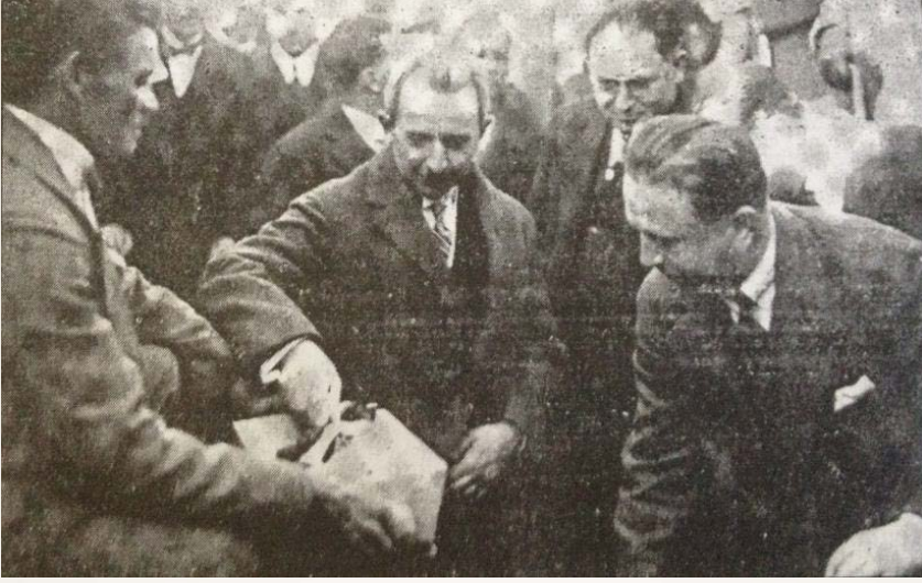
Şekil 1: Başbakan İsmet İnönü Türk Ocağı Merkez Heyeti binasının temel taşının harcını koyarken (21 Mart 1927)

Türk Ocağı'nın faaliyetlerini gerçekleştirebilmesi için ihtiyaç duyduğu mekânlar, Cumhuriyet hükümetlerinin ve bizzat Atatürk'ün yardımlarıyla yapılmıştır. Zaten Cumhuriyetin ilk yıllarında önem verilen bayındırlık faaliyetleriyle savaşlarda viran olmuş Anadolu şehirlerinin geliştirilmesi ve başkent Ankara'nın yeniden tasarlanmasına gayret edilmektedir. Cumhuriyetin başkenti olduğu için Ankara'nın imarına önem verilmektedir. Türk Ocağı'nın merkezinin Ankara'ya alınması ve ardından bina tahsisi ve kendine has mimarisiyle yeni bina yapımı hep aynı değişimin bir parçasıdır. Eski bir binada faaliyetlerini sürdüren Ankara Türk Ocağı, genel merkez haline gelince bina yetersiz kalmıştır. İhtiyaca cevap vermesi için bugünkü tarihi Türk Ocağı binasının temeli 21 Mart 1927'de atılmıştır. Temel atma törenine Gazi Mustafa Kemal Paşa'nın emriyle Başbakan İsmet Paşa katılmıştır. Temel atma merasiminde toplanan kalabalık binanın ilkelerini bir parşömen kâğıdına yazıp imzalamıştır. Bu kâğıt bir şişe içine konulduktan sonra zeminde bulunan betonarme kasaya yerleştirilmiştir. Sonra kasa mermer levha ile kapatılmış ve İsmet Paşa ilk harcı koymuş, yapıya ilk taşı yerleştirmiştir (Anonim, 1930: 80-99).