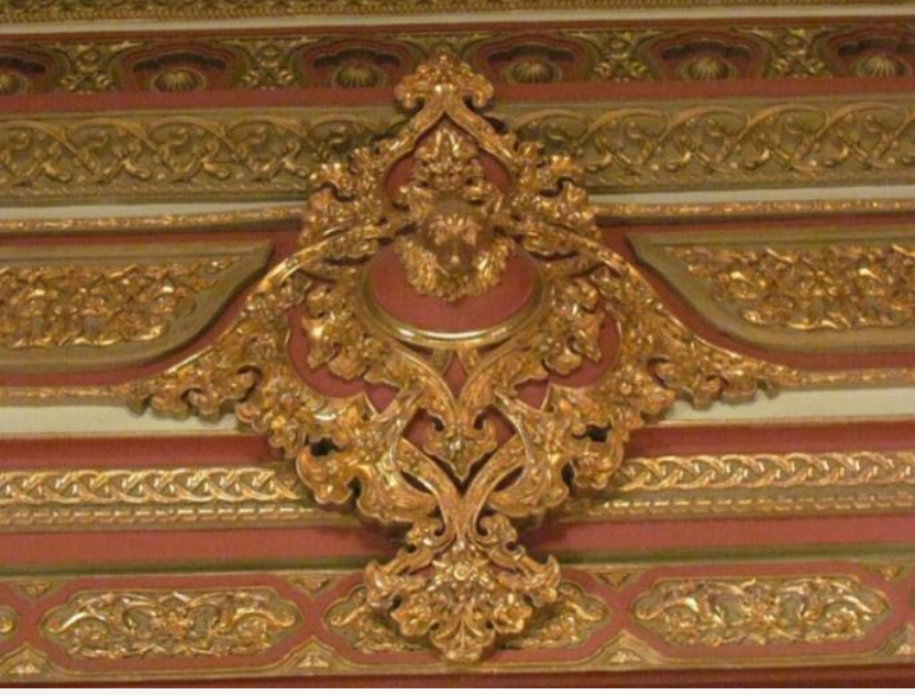
Şekil 2: Türk Ocağı Merkez Heyeti binası tiyatro salonundaki Bozkurt sembolü

Atatürk'ün mali problemleriyle yakından ilgilendiği yeni bina 23 Nisan 1930'da açılmıştır. Hemen ardından yapılan Türk Ocağı Kurultayına Cumhurbaşkanı Mustafa Kemal de katılmıştır. Ocak binası, Cumhuriyetin millet yaratma ideolojisini ve ülkenin modern yüzünü cisimleştiren bir simge olarak kabul görmüştür.